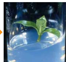
写真4:シュート(茎と葉)が生育してくる