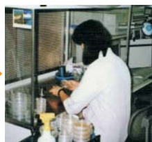
写真2:クリーンベンチ内で茎頂を取り出し