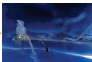
写真6:植物ホルモンなし、暗所で1ヶ月培養→シュートが出てくる