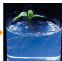
写真7:16時間照明下で1ヶ月間培養すると幼植物体ができる