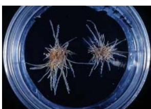
写真5:不定根の増殖