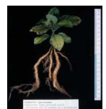
写真8:1ヶ月の馴化(25℃、80%湿度、16時間照明)を経て、土壌に移植すると正常に生育する