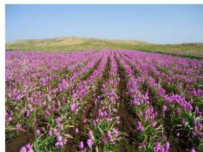
“魔女の雑草”と呼ばれるストライガ